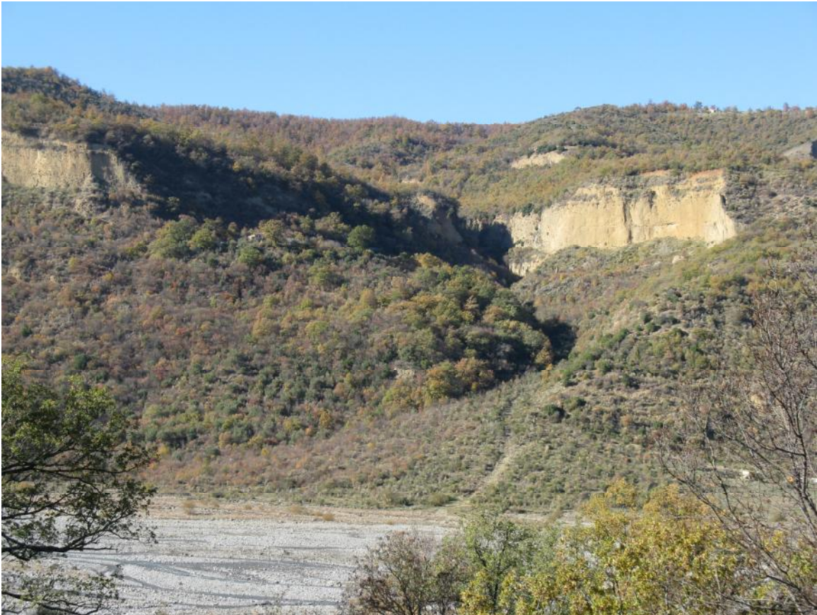
Il fosso prima dello sbancamento dei giorni scorsi

"Balze" mi è sembrata una parola che può meglio evocare i paesaggi naturali spettacolari, di "naturale" bellezza estetica, dispiegati in un tratto del costone che scende sul Sarmento tra fossi, dirupi e coni di deiezione, a comporre uno scenario eccezionale, unico e irripetibile. Nella sentieristica di valle e nel Piano Pluriennale di Sviluppo Socio-Economico, approvato dal Consiglio della Comunità Montana Val Sarmento il 26 marzo 2009, ho suggerito di chiamare "balze" quei luoghi che rappresentano punti di forza da tutelare e da valorizzare.