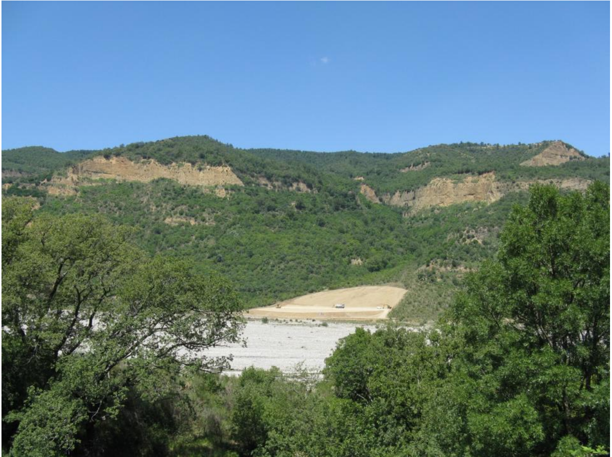
Il fosso dopo lo sbancamento

Si sta per trasformare monumenti naturali importanti del nostro territorio; si sta per incidere sui "documenti storici" della nostra esistenza in Val Sarmiento. Vedo, intanto, un grande sbancamento che ha già mutato l'immagine originaria del fosso Mistro sotto la Timpa dei Preti nel territorio di Noepoli.