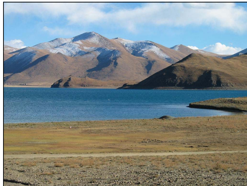
Uno scorcio del Lago Moriri meta finale dei nostri soldati

Un documentario che potrebbe dare molti spunti di discussione ed anche delle idee per un confronto fra generazioni.