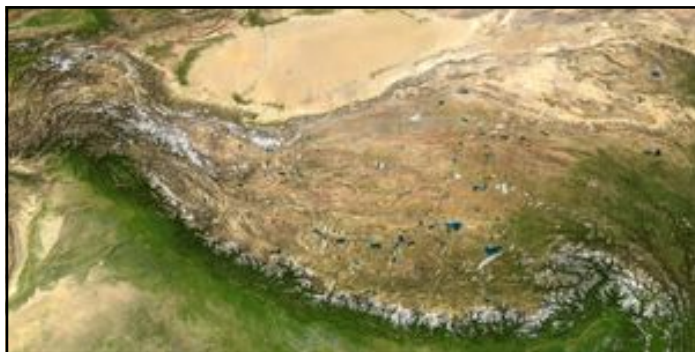
La catena himalayana vista dal satellite

“... .. Tutti i vecchi avvertono il bisogno di descrivere gli anni che hanno attraversato. A troppi viene impedito, isolandoli da chi li potrebbe ascoltare. Ficcati in un cronicario, al ricovero dei vegeti agonizzanti, che pure se assume un nome più accattivante resta sempre tale, spargono semi di memoria nel deserto più infecondo. E ne muoiono. Bisognerebbe rendere istituzionale questo diritto alla trasmissione del ricordo. Per tutti. Uno sgabello, se non una cattedra, dove ciascuna donna e ciascun uomo nell’età avanzata abbiano l’agio di narrare i tempi della gioventù, cioè di effondere la memoria della forza passata ... ..”