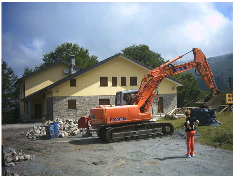
Figura 3 - fasanelli - frontale

rifugio. A partire da quello che il WWF costruì nel 1950 nella piana Ruggio (vedremo dopo).