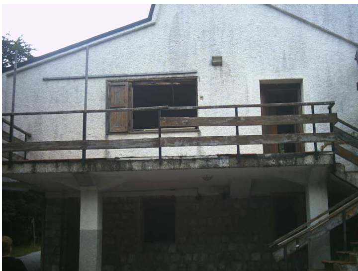
Figura 6 - Rifugio Colle Ruggio

Il discorso più penoso è il rifugio di Colle Ruggio a mt 1563 (sempre in quota al Comune di Rotonda).