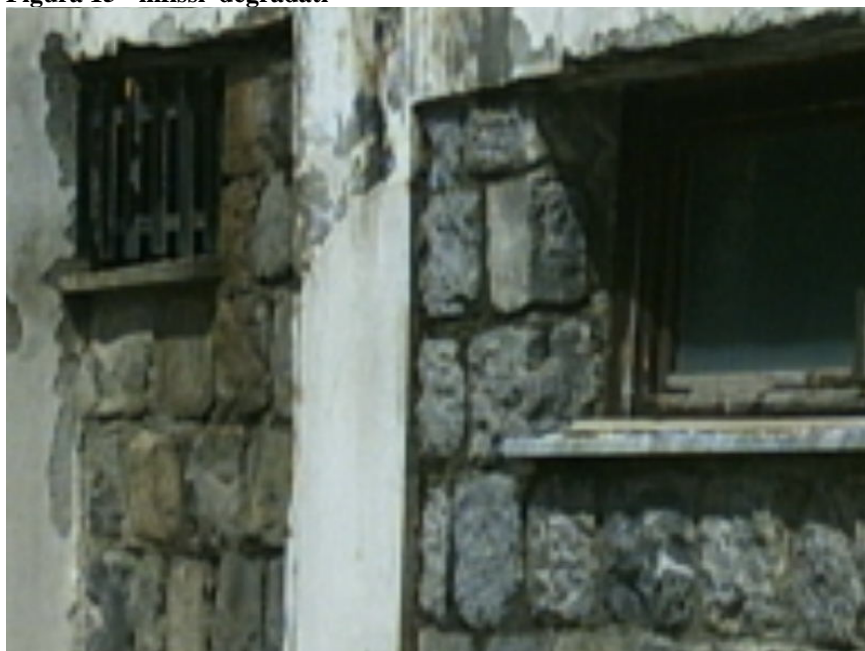
Figura 15 - infissi degradati