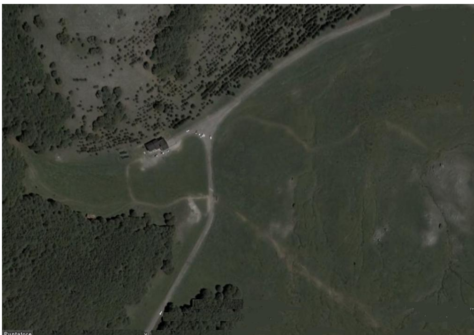
Figura 11 - veduta aerea del rifugio De Gasperi

Nella figura aerea è possibile inquadrare bene il rifugio che sovrasta la pianura appena sotto la Serra del Prete la montagna che si trova accanto al Pollino.