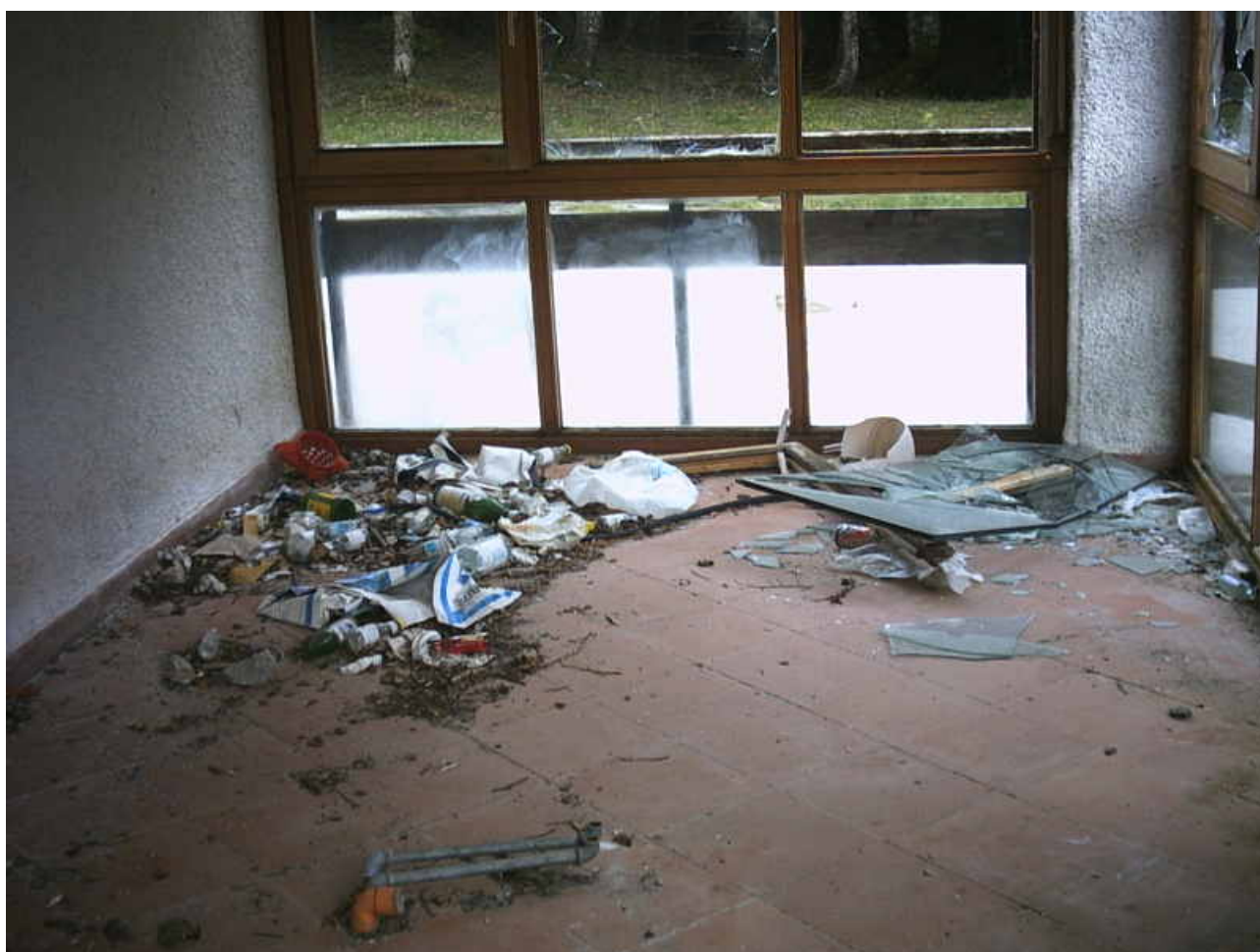
Figura 8 - interno del rifugio colle ruggio