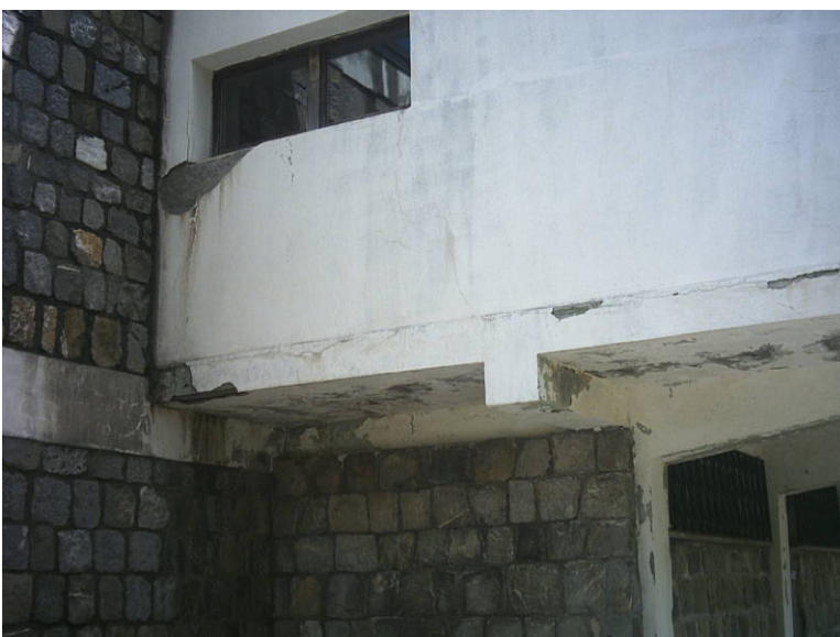
Figura 14 - particolare del lato est