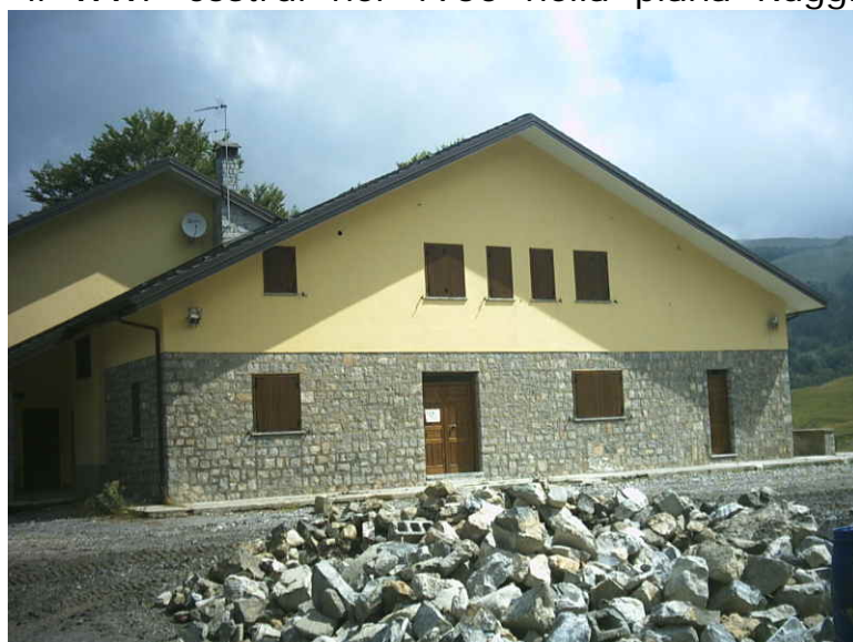
Figura 4 - Fasanedettaglio frontale

E' una trasformazione un po' esagerata. Perché a quella quota servono strutture agili, snelle, funzionali e di...servizio al Parco, questa era la filosofia del bivacco