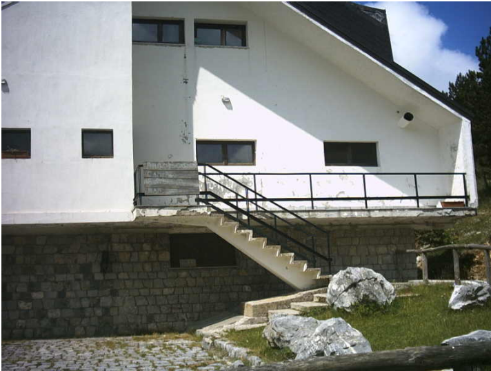
Figura 12 - particolare del frontale

Si notano nelle foto che seguono alcuni dettagli di intonaco caduto e di infissi da sanare.