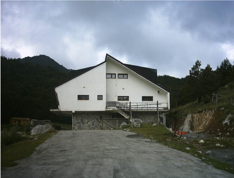
Figura 10 - Frontale del rifugio De Gasperi

Nella stupenda piana di Ruggio si trova, a 1535 mt, il rifugio De Gasperi, una costruzione che risente del tempo, e lì da 70 anni forse.