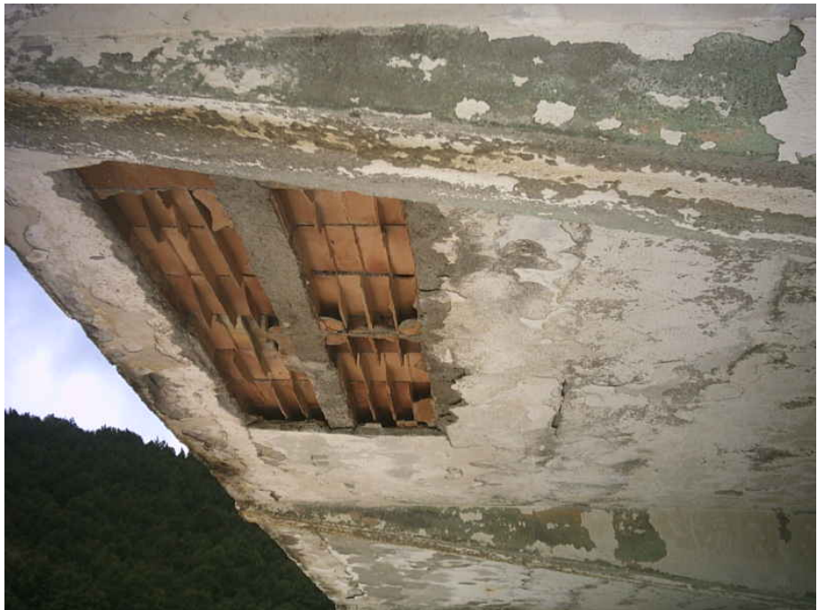
Figura 13 - l'intonaco caduto