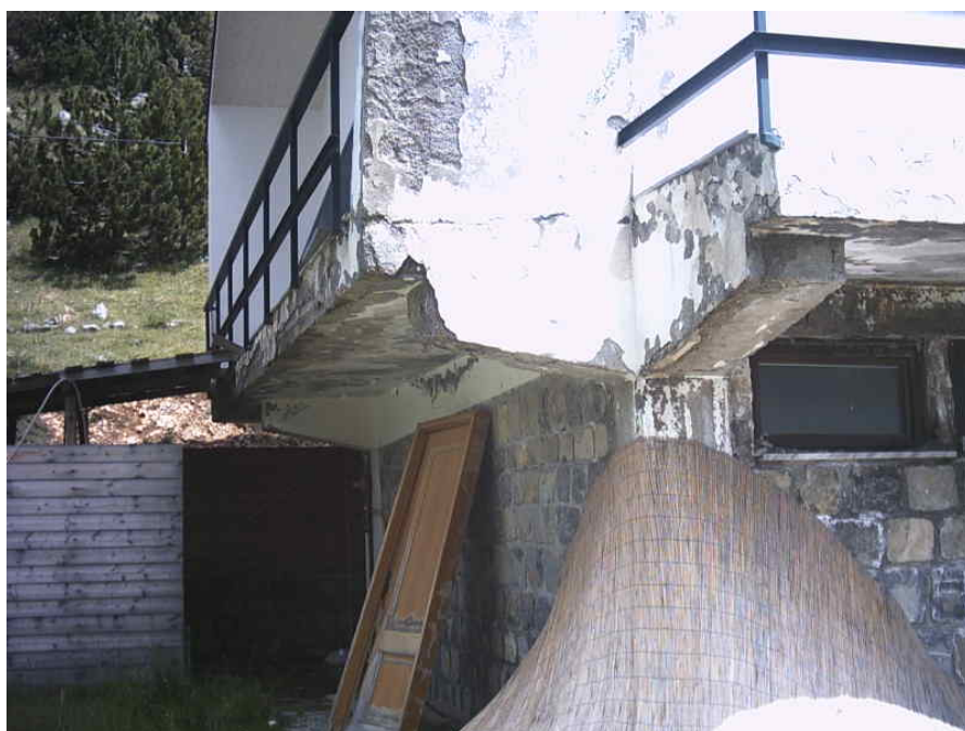
Figura 16 - il retro della struttura